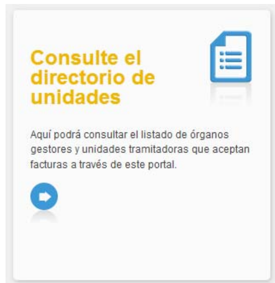
Ilustración 1: Acceso al directorio de unidades

Los organismos que están dados de alta están recogidos en el DIRECTORIO DE UNIDADES. Dicho directorio es accesible desde la home del portal de proveedores.