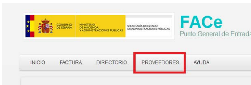
Ilustración 5: Acceso certificados proveedores

La seguridad que implementa FACE a nivel de comunicación por servicios web requiere firmar los mensajes que se remitan a través de esta interfaz con certificado electrónico reconocido soportado por la plataforma @firma del MINHAP, puede comprobar si su certificado es válido en http://valide.redsara.es . FACE permite la autogestión de estos certificados a los proveedores directamente, a través del portal face.gob.es .