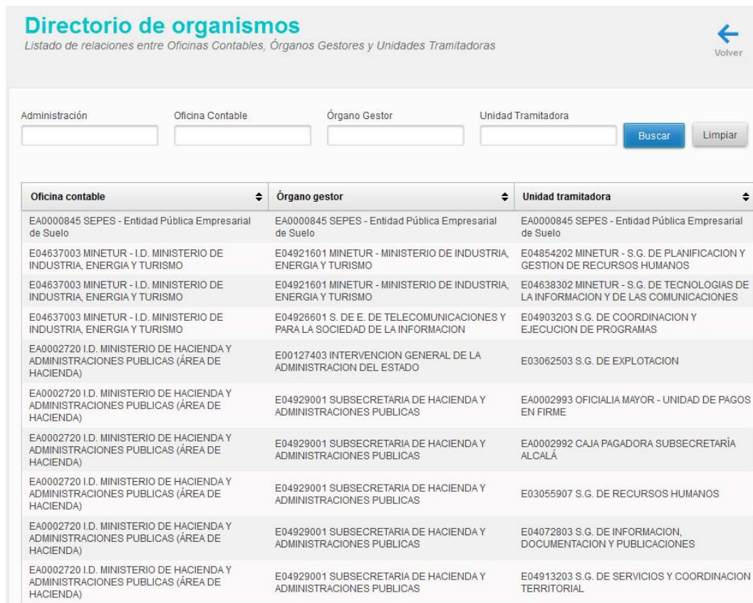
Ilustración 2: Relaciones